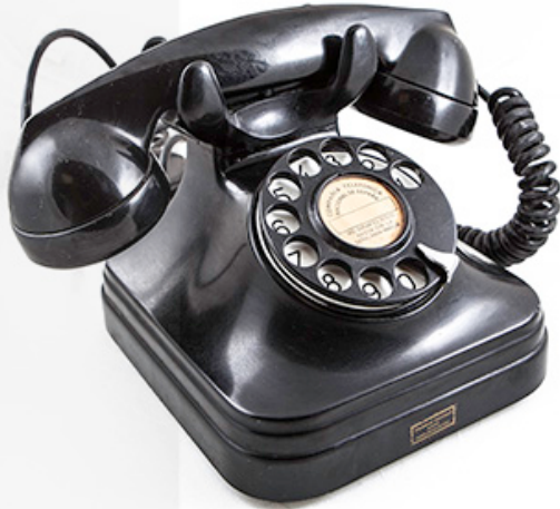
Telèfon utilitzats a les habitacions dels hotels durant els anys 60, 1957 / Salvador Mira Gregori

volta com a anècdota del poc ús que se li dona. En canvi, sí que ens fixem en l'alcanç de la WIFI només arribem a un hotel, que ens dóna cobertura a tots els dispositius mòbils dels que disposem.