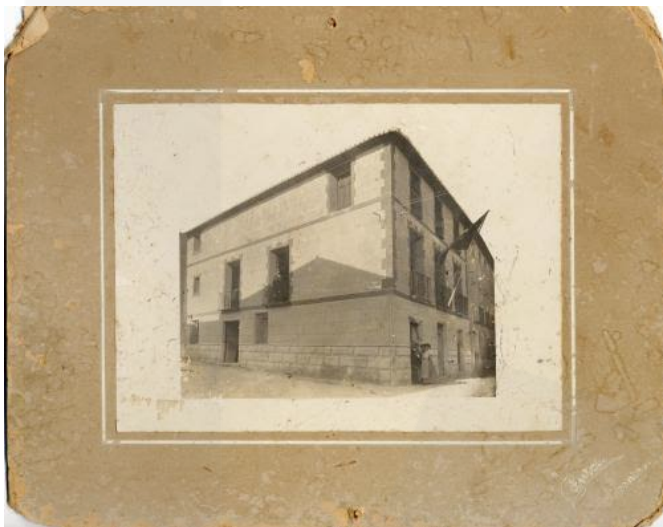
Centre familiar de Telefónica a l'actual carrer del Passeig de la Carretera, 1909

Durant el dia, l'oficina, que es trobava pegada a l'Ajuntament i darrere tenia la presó, estava oberta al públic durant tot el dia fins a les 22 hores de la nit. Però a la nit, encara que tancara al públic, prestava el servei a qui el reclamara. Havien de tornar-se per menjar i per dormir. Podem dir que la seua feina era la seua vida, durant eixos anys tan intensos. No només havien de treballar dins del centre sinó que havien d'eixir a cobrar als clients i també avisar dels avisos de conferència perquè anaren a la central en un dia i hora acordada.