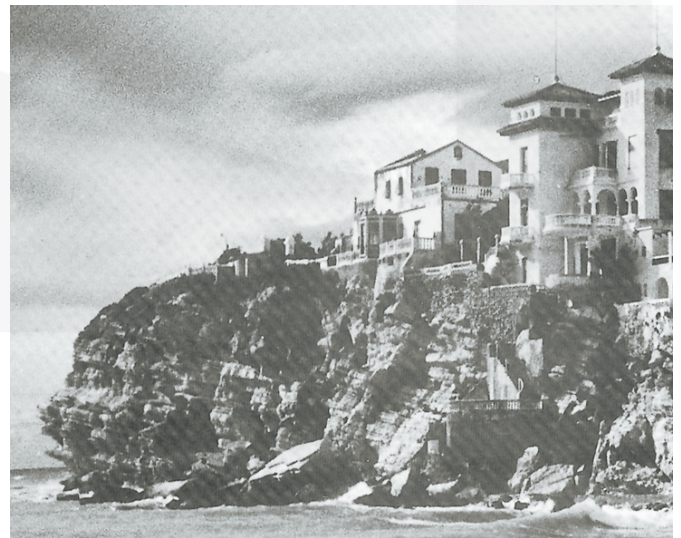
Castell de Benidorm

l'escassetat de població cristiana, al fet que per motius religiosos musulmans i cristians no podien tenir les mateixes. També s'a nomena el bany, element típic del món musulmà per tal de complir el precepte de la puresa ritual que estableix l'Alcorà i que sol aparéixer a les cartes de poblament musulmanes. Finalment, s'inclouen els arrossars entre els monopolis senyorials i és molt probable que estarien treballats per musulmans, per l'experiència que en tenien. Segons Rafael Azuar, el cultiu de l'arròs en Sharq al-Andalus s'havia introduït al segle XI quan, com a conseqüència de les guerres civils subsegüents a la caiguda del Califat de Còrdova, moltes persones d'Andalusia fugiren cap a la nostra zona i renovaren la seua agricultura. Tot utilitzant les zones d'albuferes i marjals del litoral feren de Sharq al-Andalus un dels centres més importants del cultiu de l'arròs. A Benidorm, aquest cultiu es localitzaria, possiblement, a la zona d'albufera del racó de l'Oix. Les alqueries eren també un monopoli que es reservava Bernat de Sarrià i si estaven treballades per mudèjars eren més rendibles.