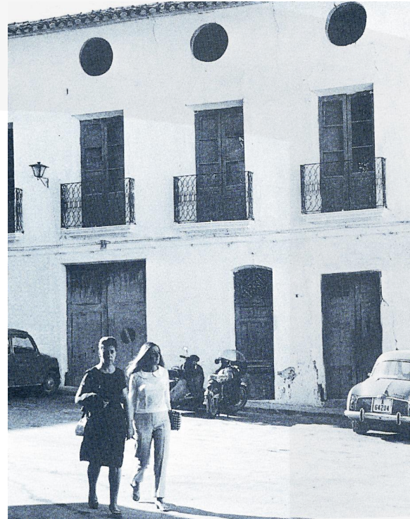
L'hostal Patty Stratton (1957)

Beatriu Fajardo ja havia gastat 6.000 lliures en la construcció de la séquia i del molí fariner de Polop. Per tant, no disposava de prou efectiu per fer front a les noves despeses i sol·licità a la Reial Audiència de València permís per a carregar amb un censal de 4.000 lliures les senyories de Polop, Benidorm, Xirles i la Nucia. Un censal era una mena de préstec hipotecari amb la garantia de les terres i possessions del sol·licitant: els bens de dita donya Beatris, casses, heretats, vinyes, fils de aigues, molins, forns, olivars, i altres qualsevols bens . També els veïns quedaven obligats pel censal: als documents es diu que el carregament el fa Beatriu Fajardo juntament amb Geroni Cabot que representa les autoritats i veïns de les senyories.