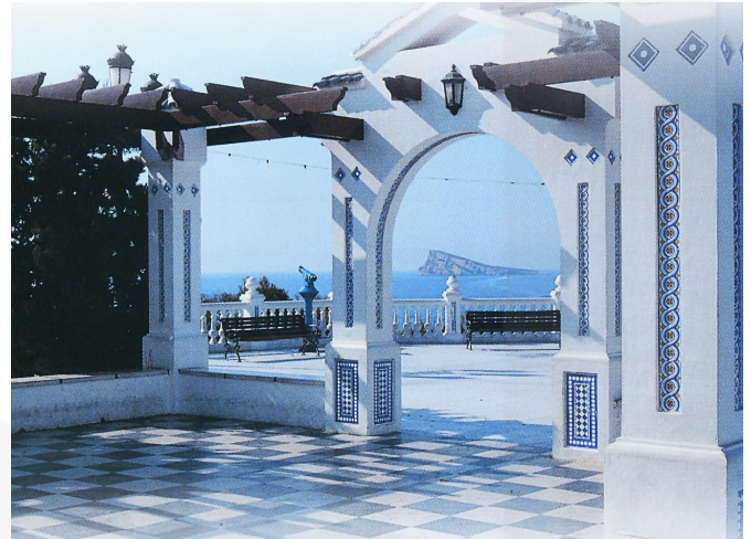
Plaça del Castell/PAO (1999)

com suggereix l'informe de les excavacions arqueològiques de 1993. Sembla que uns fonaments de grans sillars de pedra apareguts farà dos anys en un enderroc del carrer Alacant, formant una línia levant-ponent paral·lela al carrer dels Quatre Cantons són amb molta probabilitat d'origen romà. Ignorem si aquesta fortificació romana tingué continuïtat en època islàmica.