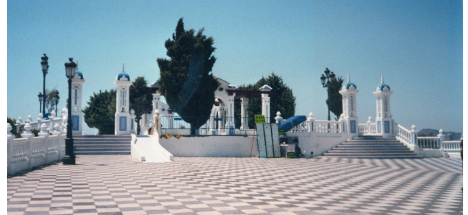
Segona plaça del Castell/ PAO (2010)

de 500 hòmens; en 1275 el castell de Polop passà a mans de Beltrà de Bellpuig i als seus hereus amb la condició de residir-hi.