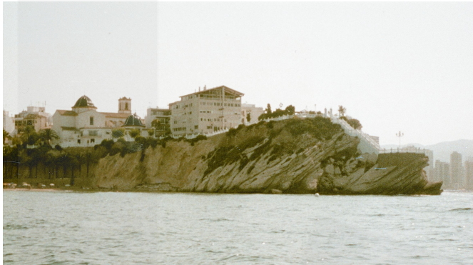
Vista del Castell des de la mar/ PAO (1999)

Al llarg de la història de Benidorm, el castell ha estat un element molt important i en bona part ha determinat el seu esdevenir històric. Quan Benidorm va perdre el seu caràcter de municipi i quedà quasi despoblat, el castell per la seua contribució a la defensa del Regne de València, va tenir continuïtat d'ocupació i va evitar que Benidorm desapareguera físicament.